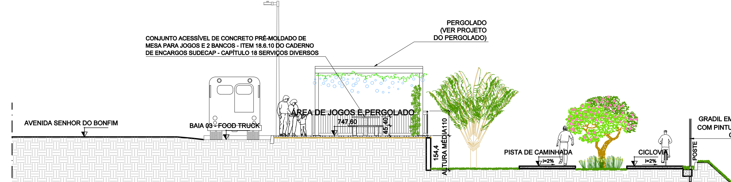
CORTE BB - CALÇADÃO E ÁREA DE FOOD TRUCK ESC ..... 1/100